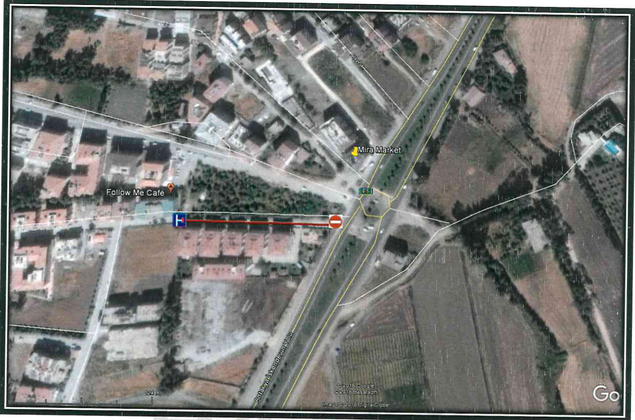
Kroki-1- Serinyol Mahallesi Yeni Sokağa Girişini Gösterir.

Handwritten signatures and notes in blue ink, including the text 'BÜYÜKŞEHİR BELEDİYESİ' and various initials and marks.